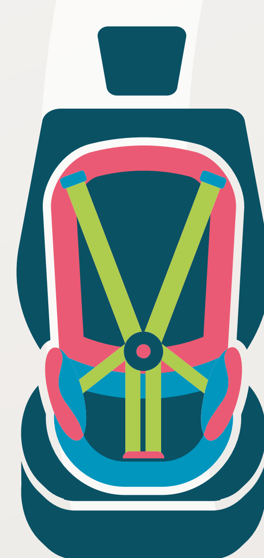
مقعد السيارة المواجه للأمام • من عمر ٤ - ٧ سنوات • مع استخدام أحزمة السلامة