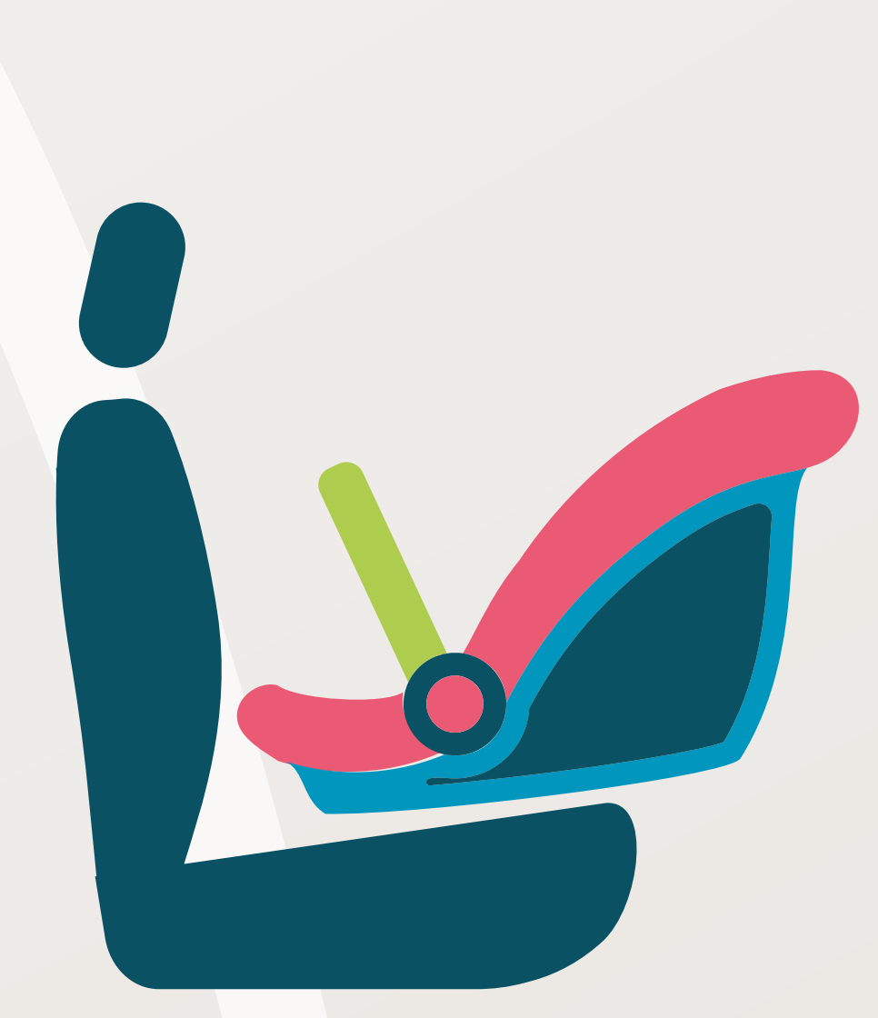
مقعد السيارة المواجه للخلف • منذ الولادة إلى ١٢ شهراً • إبقاء الطفل لأطول فترة ممكنة حتى ٣ سنوات