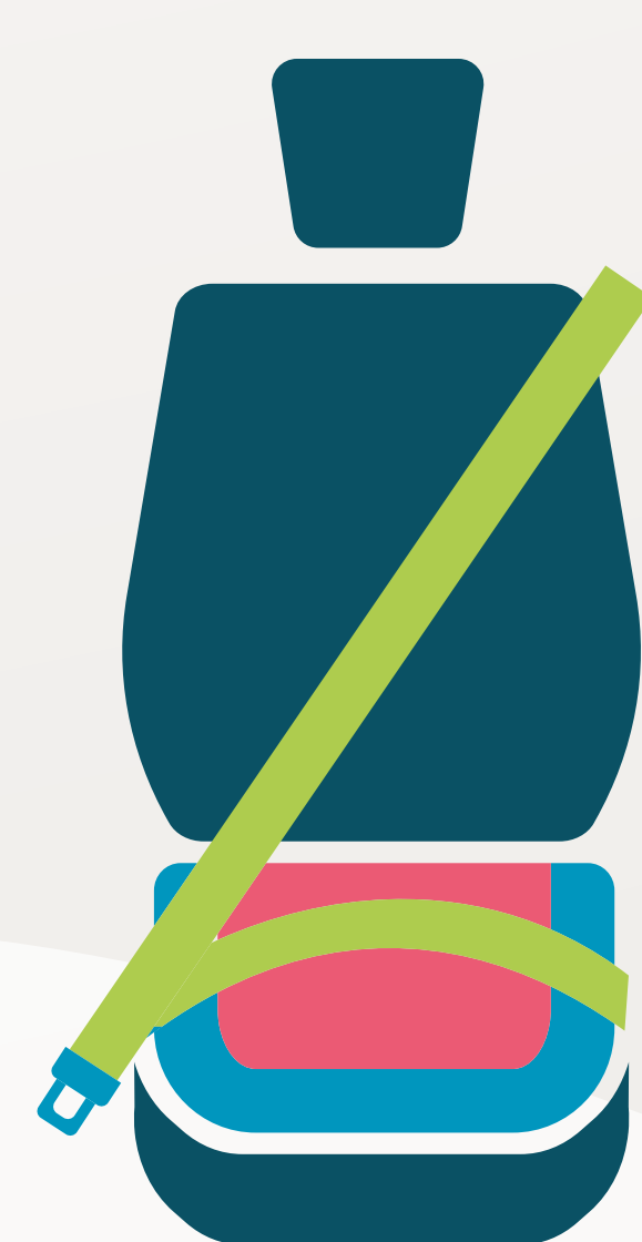
المقاعد الرافعة • من عمر ٨ - ١٢ سنة